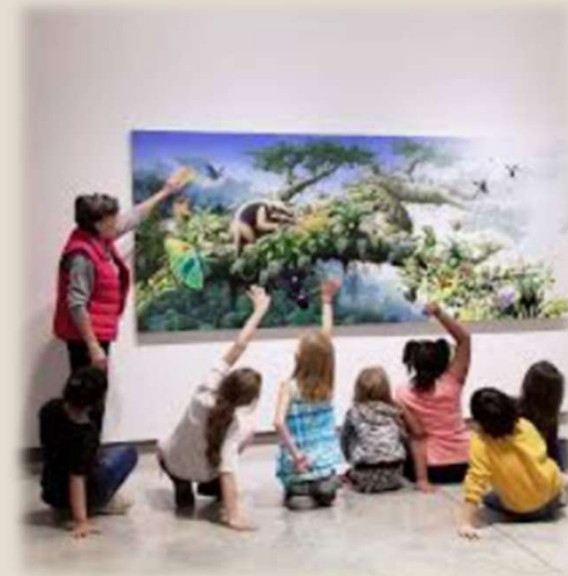
Visual Thinking Strategy